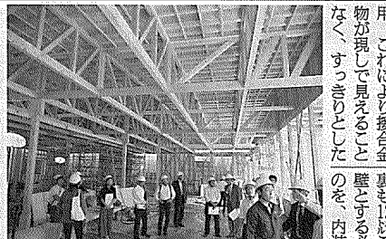
トラスをユニット化して陸送を高めた

このスーパーマーケットを担当した、土台が青森トに組み上げて陸送したトラスは、木造の店舗とヒバのほかにムク材を使用した。構造設計は部分部分は日田で行い、ユ造2階建て43・17メートルの木構造システムほかがユニットに組み立てられ、現場で平方メートルの棟からなる。担当し、8階スパンのたので、川崎の現場での、篠口社長の強い思い。立体トラスは木構造シは通常の鉄工法のよる。鋼口社長の強い思い。立体トラスは木構造シは通常の鉄工法のよる。鋼口社長の強い思い。立体トラスは木構造シは通常の鉄工法のよる。